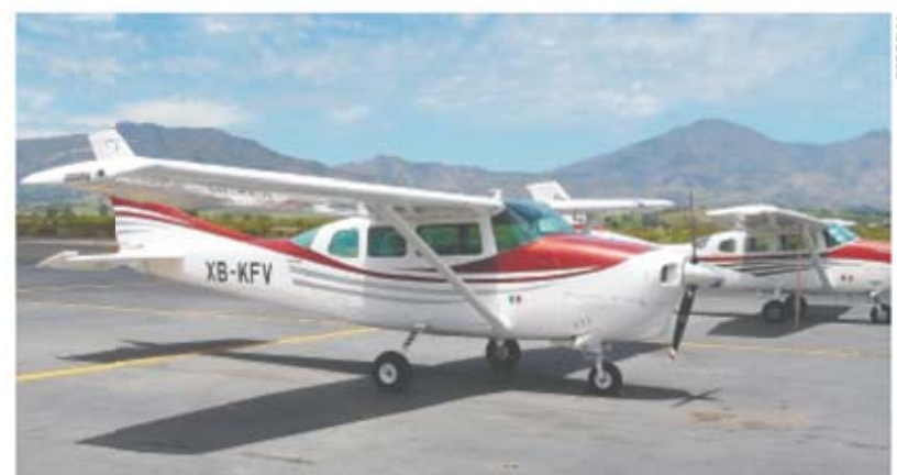
Las aeronaves son parte de las propiedades que la PGR ha decomisado a cárteles, mismas que después son puestas a subasta.

contrar: inmuebles, dinero en efectivo, cuentas bancarias en moneda nacional y extranjera, vehículos terrestres, aeronaves, embarcaciones, joyas y piezas de menaje (vajillas de ujo).