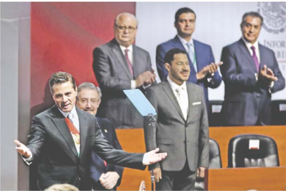
El presidente Enrique Peña Nieto rindió su 6to Informe de Gobierno. Atrás se encuentran los presidentes de la Corte, Luis María Aguilar, y del Senado, Martí Batres, y los gobernadores Graco Ramírez, Antonio Echevarría y Jaime Rodríguez.

● Destaca reformas, pero acepta que no logró recuperar la seguridad en el país